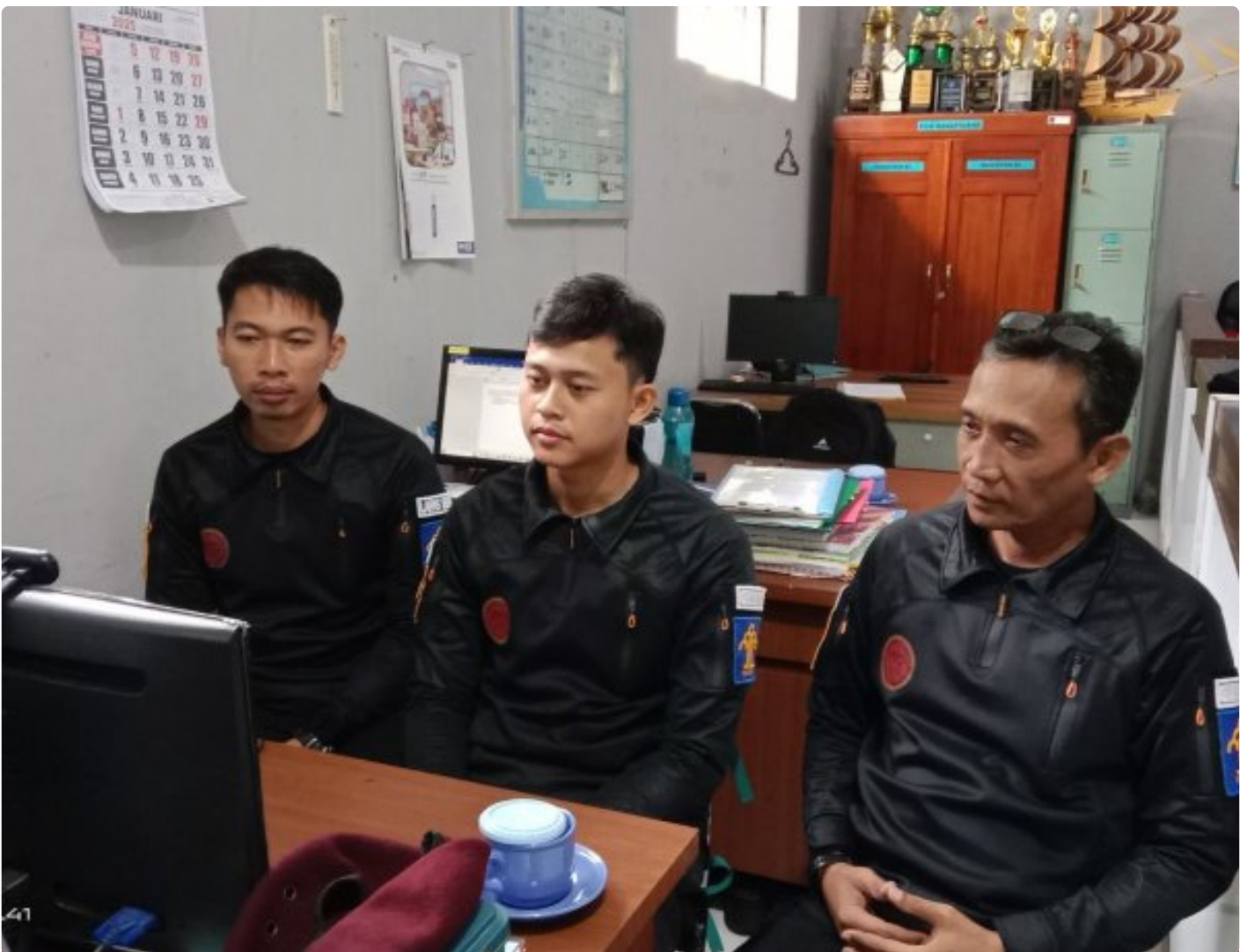
Bangun Harmoni dan Strategi, Lapas Besi Ikuti Webinar Refleksi Akhir Tahun 2024 & Resolusi 2025

CILACAP – Sebagai salah satu langkah dalam pengembangan kompetensi bagi Aparatur Sipil Negara (ASN), Petugas Lembaga Pemasyarakatan Kelas IIA Besi berpartisipasi dalam kegiatan webinar bertajuk "Refleksi Akhir Tahun 2024 dan